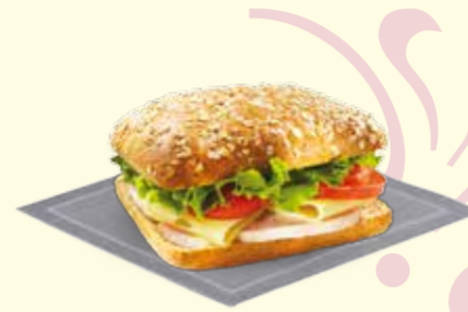
HOT TURKEY SANDWICH 6 99€