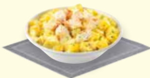
SALADE DE POMMES DE TERRE AU POULET ET AU CURRY Curry Potato and Chicken Salad 3 59€