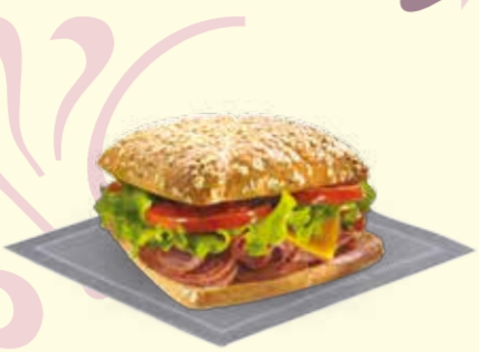
HOT BACON & ROASTBEEF SANDWICH 6 99€